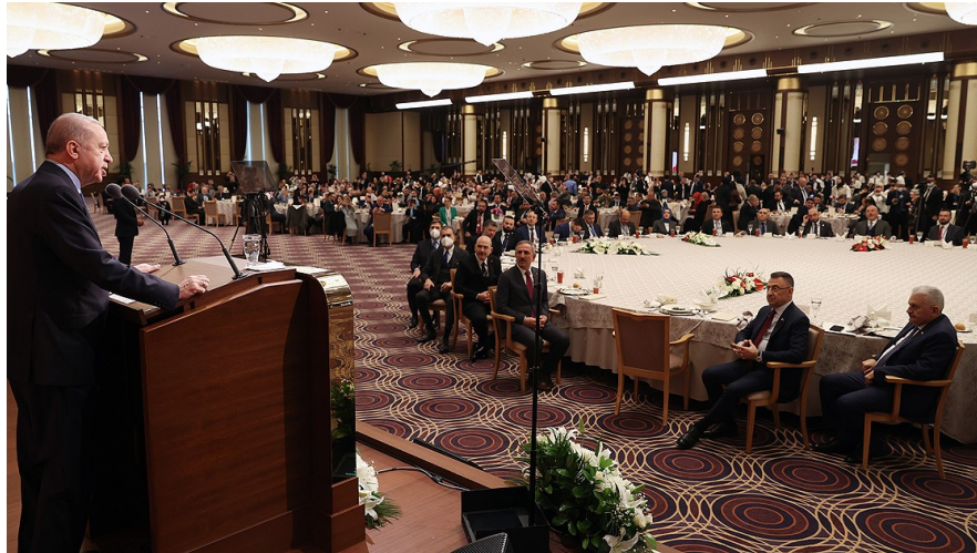
Abb. 1: Aufnahme von der UID-Konferenz Kapasite Geliştirme ve Eğitim Çalıştayı im Februar 2022 unter der Teilnahme Präsident Erdoğan. 62

2022, als führende Vertreter der UID aus zahlreichen Ländern in Ankara zusammenkamen. Auch österreichische Funktionäre wie Evren Akkuş nahmen im Rahmen des „Workshops zur Kapazitätsentwicklung und Bildung“ ( Kapasite Geliştirme ve Eğitim Çalıştayı ) teil. 61 Höhepunkt der Veranstaltung war der Auftritt des türkischen Staatspräsidenten Erdoğan, der als Ehrengast geladen war.