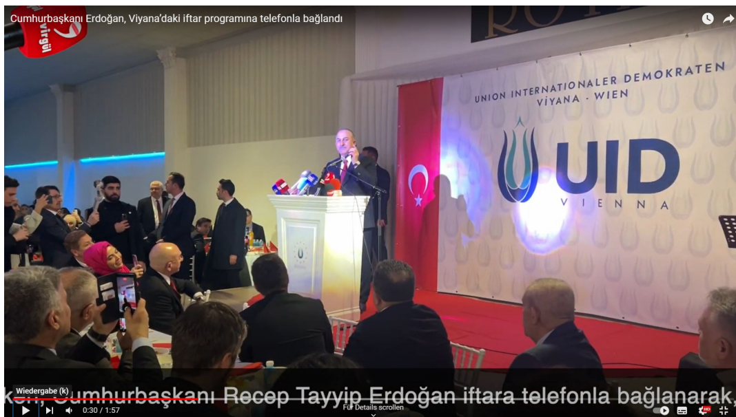
Abb. 2 Außenminister Çavuşoğlu in Wien beim Fastenbrechen im April 2023 70

sein werde, sich weltweit zu vernetzen und dabei ihre Ideologie zu verbreiten.